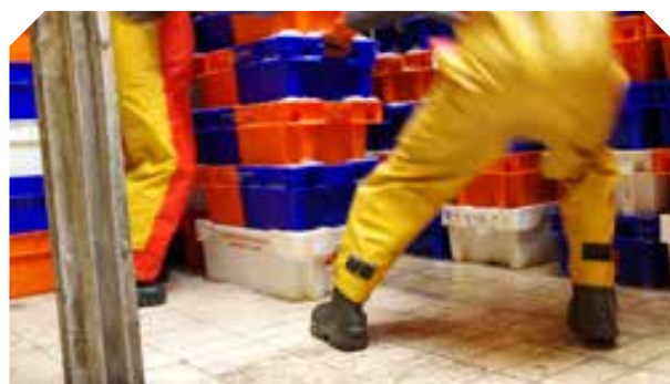
Sûres : moins d'accidents causés par des glissades ou trébuchements