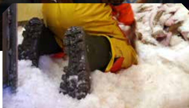
Confortable: isolante au froid pour les pieds extra chaud

Nos bottes de pêches vous tiennent et votre équipage en sécurité, au chaud et au sec . Toutes nos bottes de sécurité sont fabriquées avec notre technologie Neotane® ce qui les rend parfaites pour de longues journées de travail. Ceci tout en confort sans avoir les jambes fatiguées.